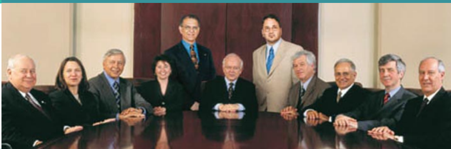
Les membres du conseil d'administration, de gauche à droite sur la photo :