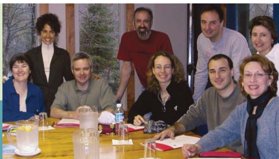
L'Équipe d'Enviro-Accès de gauche à droite en commençant par la rangée du bas :